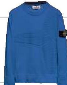
Maglia, Stone Island Junior, da 110 €.