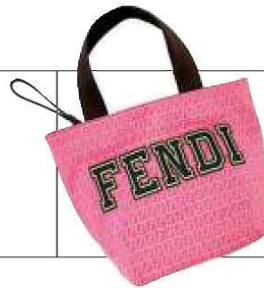
Borsetta in nylon con logo ricamato, Fendi, 198 €.