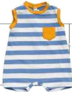
Pagliaccetto, il gufo, da 55 €.